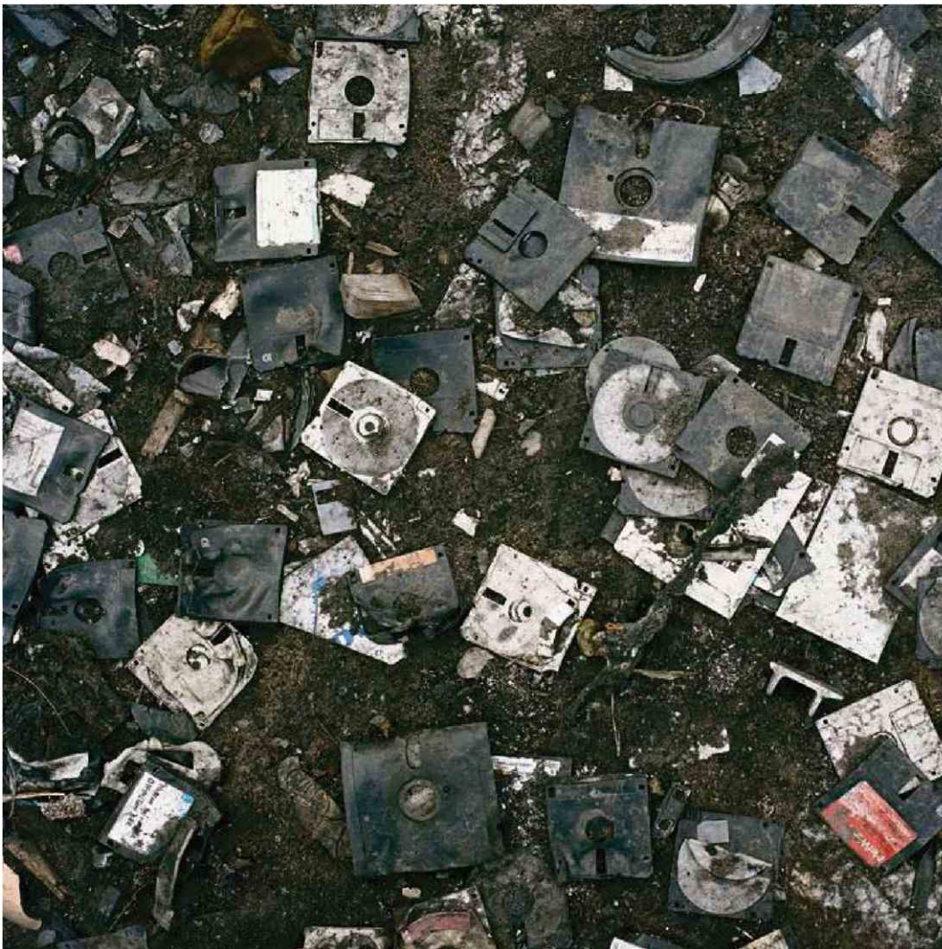
A Agbogbloshie Market, Accra, Ghana, 2010. Dans sa série « Permanent Error », le photographe sud-africain Pieter Hugo dénonce le déséquilibre géopolitique qui permet aux grandes puissances de se débarrasser de leurs déchets dans les pays pauvres.