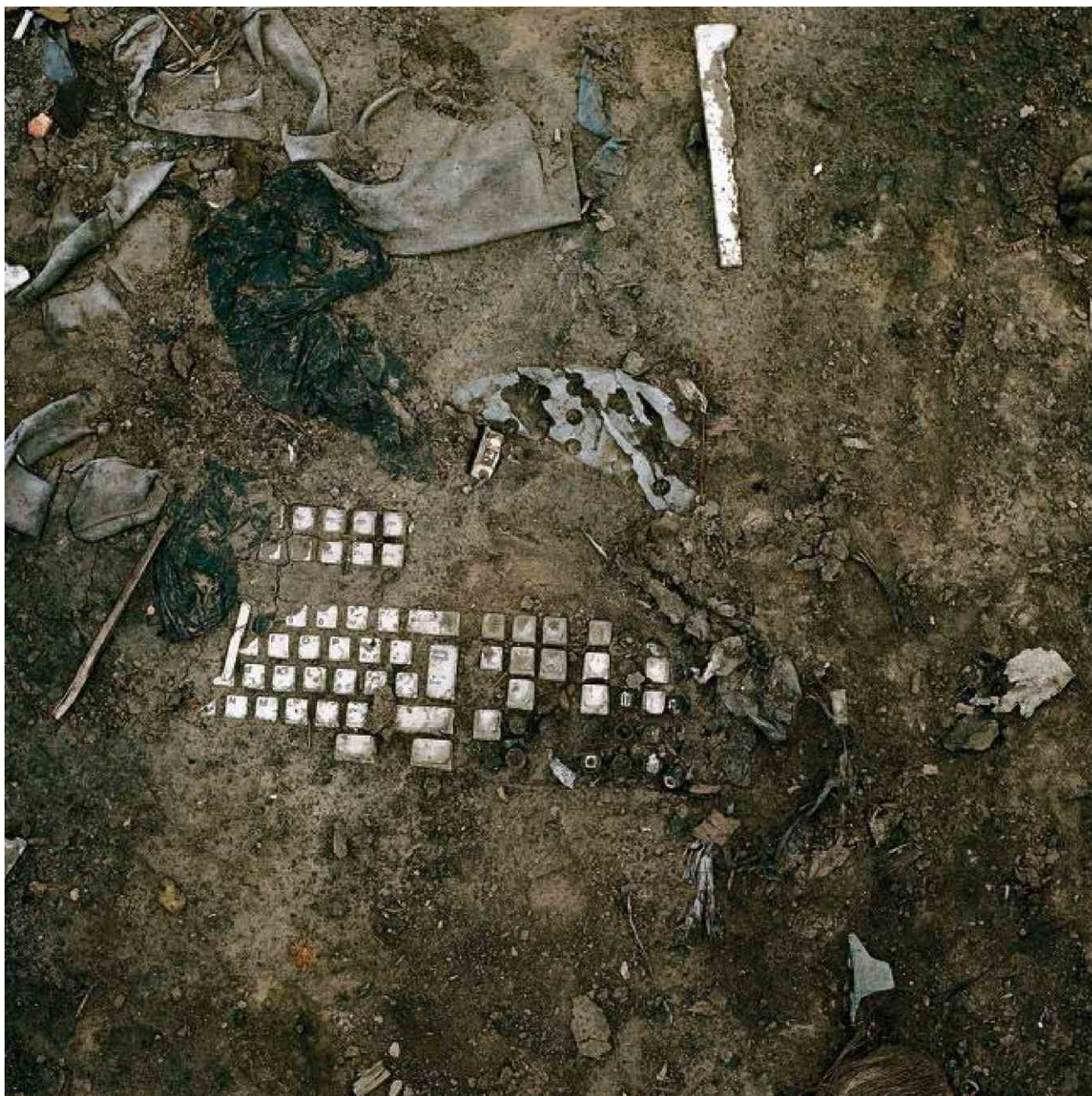
La décharge de déchets électroniques d'Agbogbloshie, près d'Accra (Ghana), en 2010. PIETER HUGO