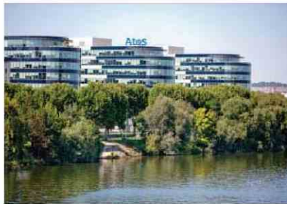
Siège social à Bezons (Val d'Oise). Atos est plombé par une dépréciation d'actifs de 2,5 milliards d'euros.

Malgré les récentes rumeurs d'OPA, le nouveau patron du spécialiste français des services numériques est visiblement à l'œuvre dans l'organisation qu'il a mise en place autour de trois métiers : l'activité historique d'infrastructures informatiques et d'infogérance, rassemblée dans un pôle baptisé Tech Foundation, qui représente la moitié du chiffre d'affaires; le digital, focalisé sur la migration vers le cloud, avec le développement d'applications spécifiques; et enfin Big Data & Security (BDS) regroupe la cybersécurité et le calcul à haute performance.