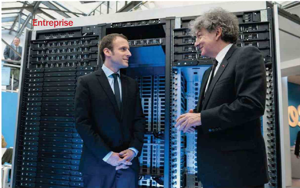
Emmanuel Macron et Thierry Breton, PDG d'Atos jusque 2019 et actuel commissaire européen devant le supercalculateur Sequana, en 2016. L'avenir du groupe est surveillé par l'Etat, qui ne laissera pas filer n'importe où le seul acteur tricolore dans les supercalculateurs.